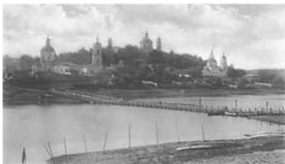
г. Дорогобуж. Общий вид. 1919 г.

описывая прекрасный, удивительный уголок на рубеже XIX-XX веков, завораживающий своей красотой.