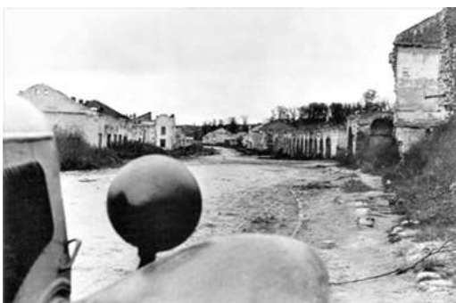
г. Дорогобуж ул. Московская. 1943 г.

Как бы сильно он ни любил Россию, это не сравнится с его любовью к