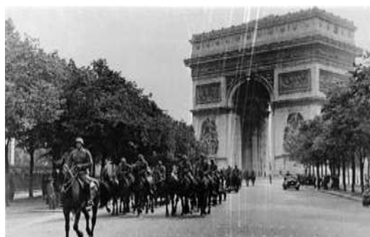
Парад немецких войск в Париже 1940 г.